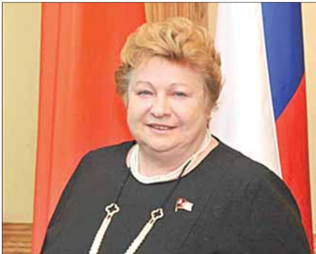
Давайте, как жители Крыма и Севастополя, все встанем за город Королёв и его процветание.

Впереди выборы. И будущее за нами, избирателями, политическими партиями, трудовыми коллективами. Если мы исполним свой гражданский долг, а не продадим голоса, уберём политические амбиции, и будем выбирать людей грамотных, не рвачей, истинных патриотов города — то судьба нашего замечательного города, каждого дома и каждого человека будет достойной.